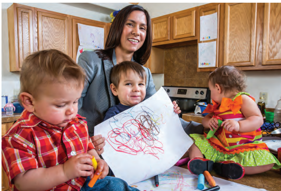
Une famille monoparentale