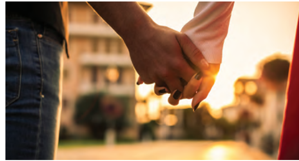
Ensemble pour la vie ?

2 c Relisez l'article et dites si les phrases ci-dessous sont vraies (V) ou fausses (F) ou si l'information nécessaire n'est pas donnée dans le texte (ND). Ensuite, corrigez les phrases fausses.